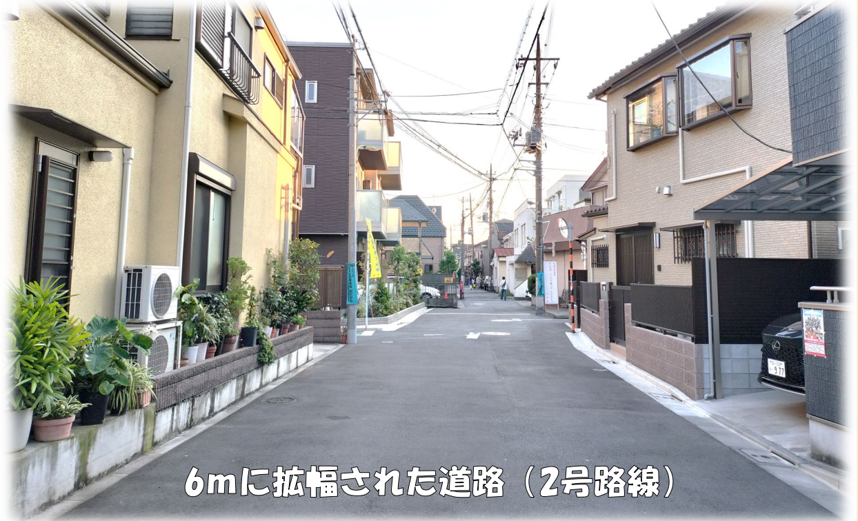
6mに拡幅された道路（2号路線）

多くの皆さまのご協力をいただき、重点整備路線の道路拡幅が進んでおります。この場を借りて御礼申し上げます。